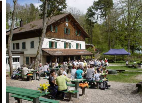
in einer anderen Umgebung

Die zweite Schulwoche verbringen die Vollzeitmodellklassen des Berufsvorbereitungsjahres des BBZ Schaffhausen in einer Einführungswoche. Diese findet bewusst ausserhalb des Schulhauses statt. Für fünf Tage sind wir auf dem Buchberg oberhalb von Merishausen (SH). Die Lernenden sind auch für das Kochen zuständig.